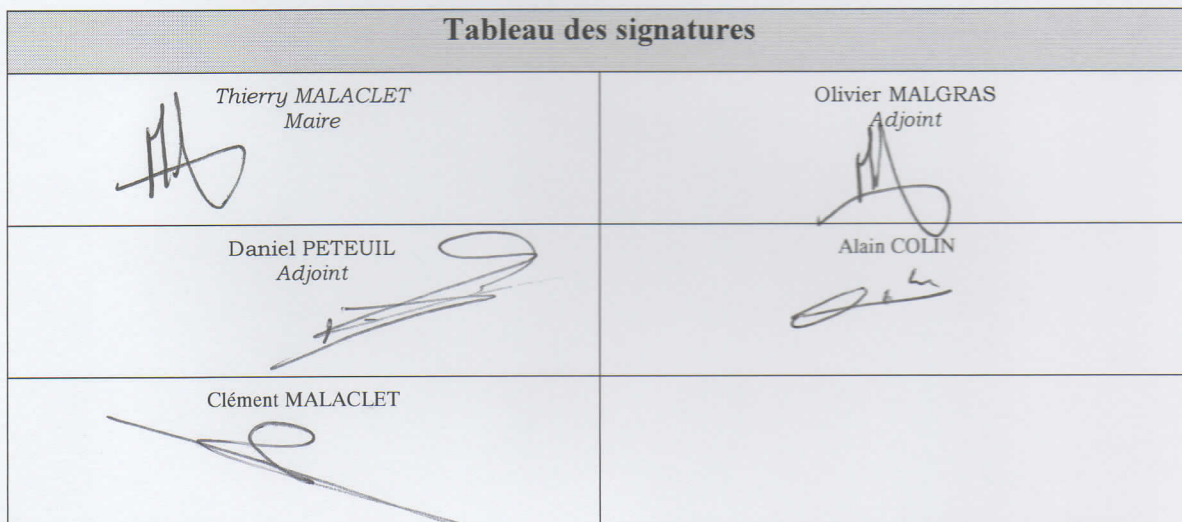
Tableau des signatures